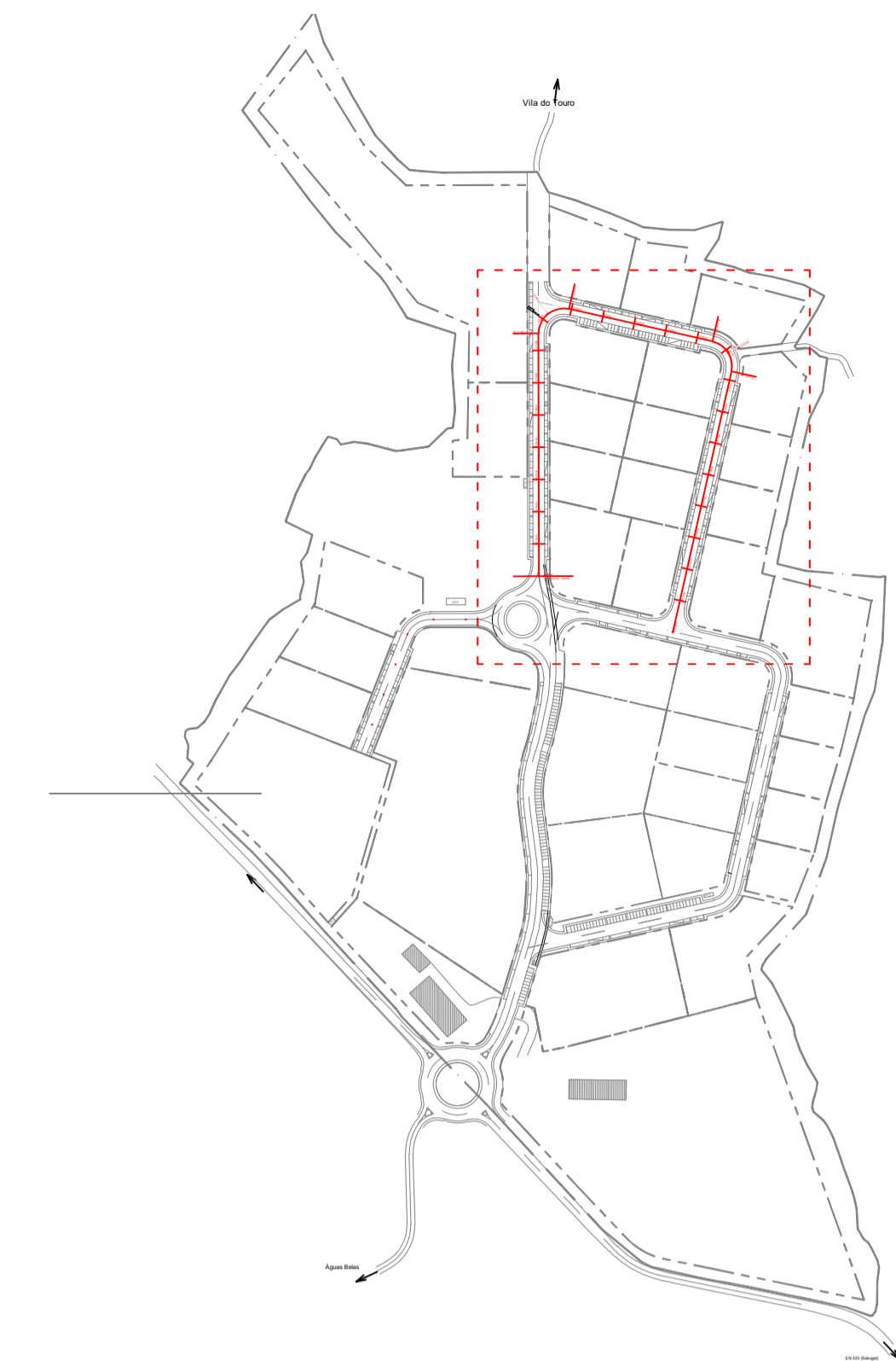
PERFIL LONGITUDINAL RUA_C