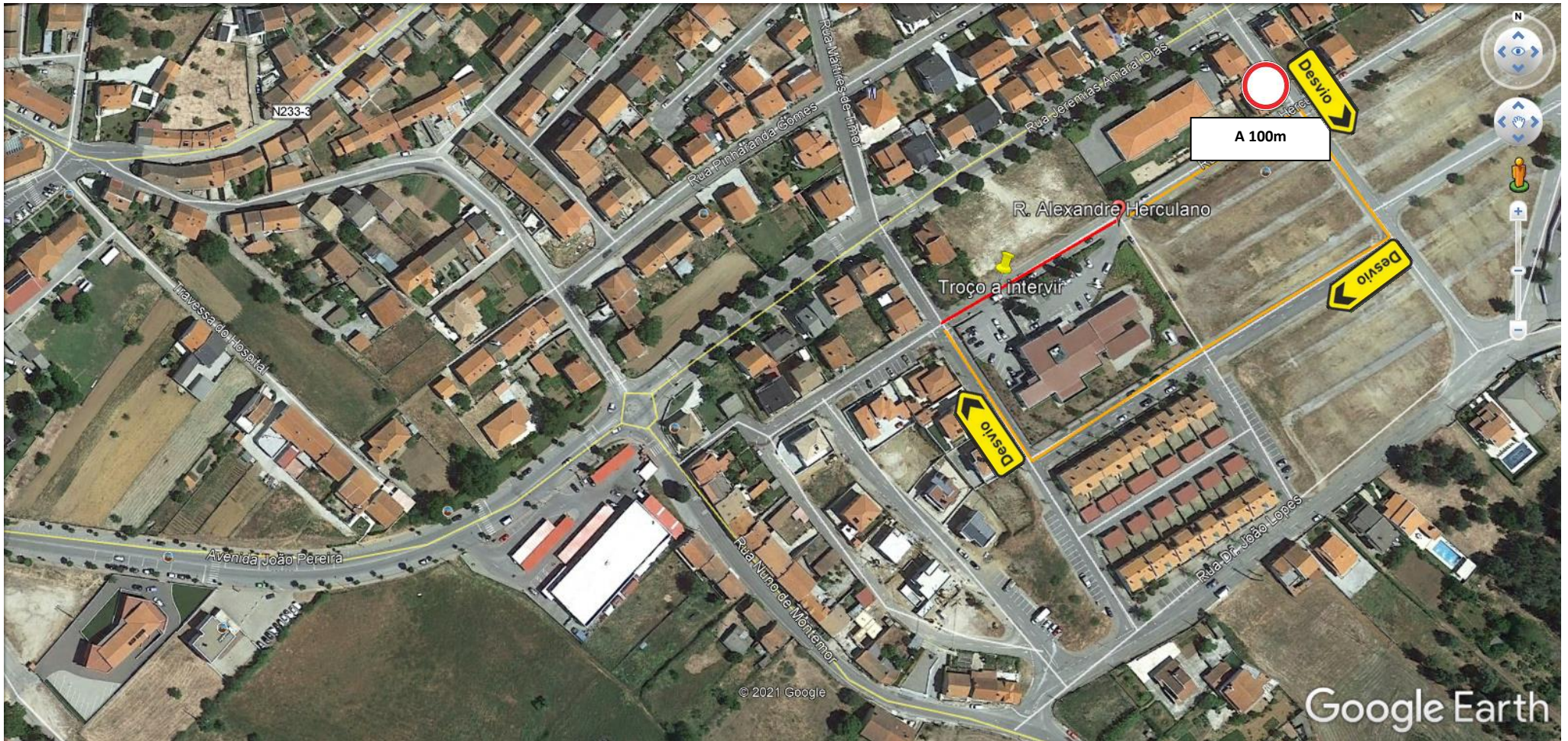
Figura 3 _Plano de Sinalização Sentido Descendente