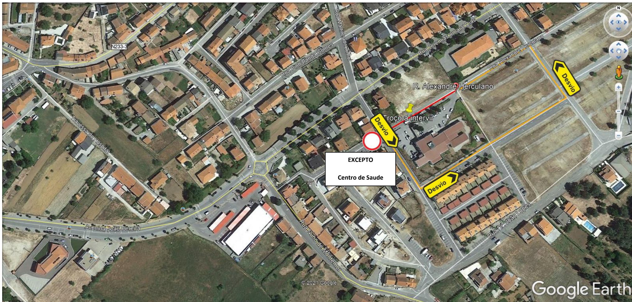
Figura 2 _Plano de Sinalização sentido ascendente