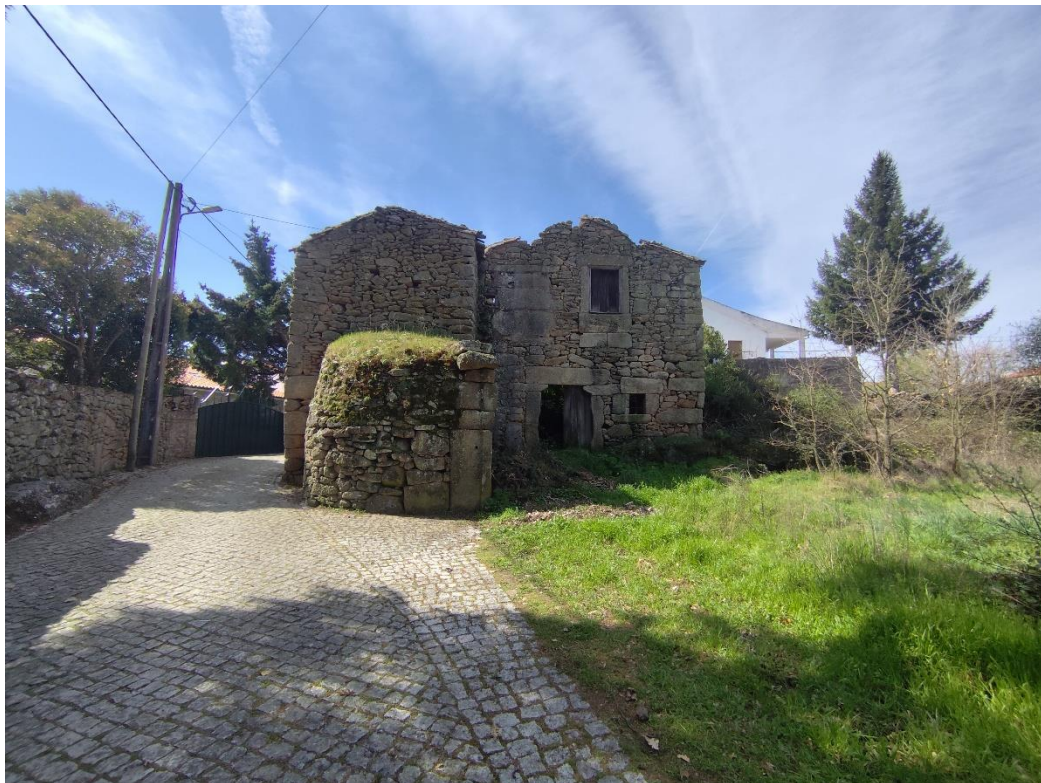
Figura 4 – perspectiva sobre Rua da Escola