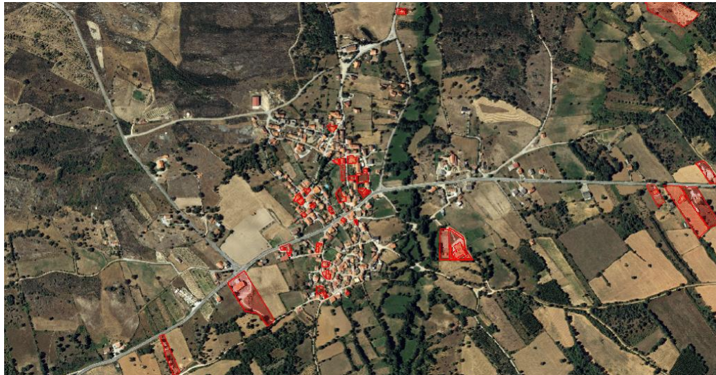
Figura 2 – Nave – Localização Operações Urbanísticas no âmbito do RJUE (entre ano 2000 e 2025)

O parque habitacional de Nave caracteriza-se na generalidade pelo bom estado de conservação, ainda que constatável a existência de um número relevante de imóveis devolutos e cujo estado de degradação justifica o desenvolvimento de uma abordagem estruturada de reabilitação urbana. Pode ainda constatar-se o baixo investimento no edificado entre o ano 2000 a 2025, pelo que, a estratégia a prosseguir deverá alavancar um processo de transformação deste território, por via da conjugação de iniciativa pública e privada.