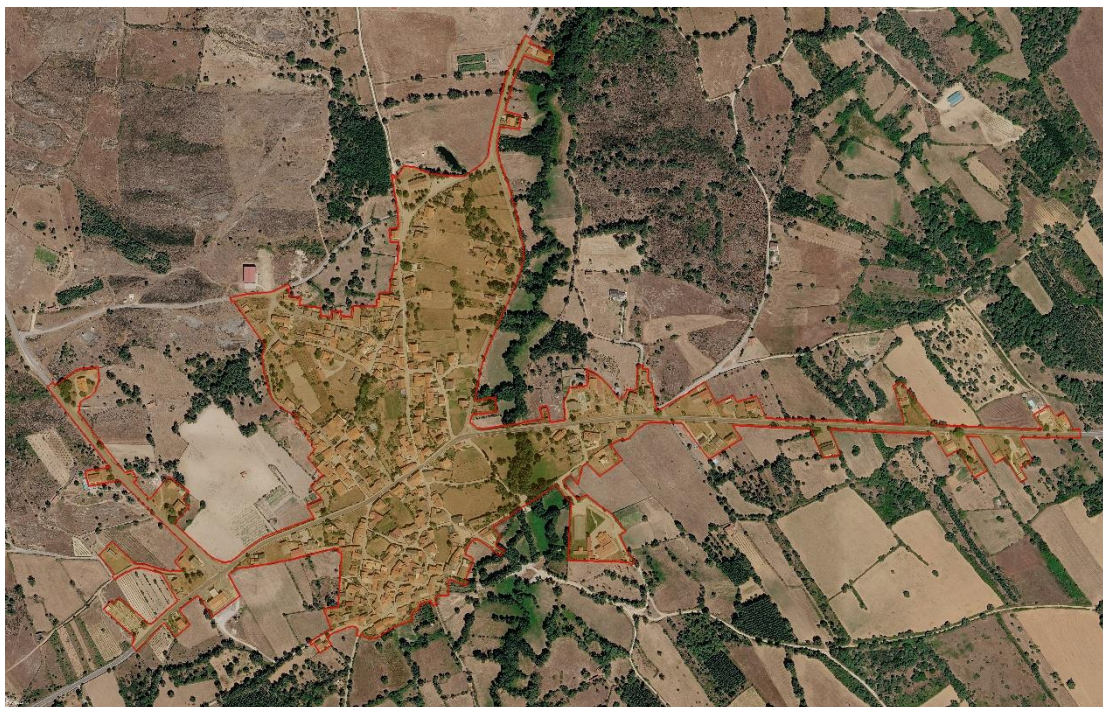
Figura 7 - Proposta de delimitação da ARU de Nave