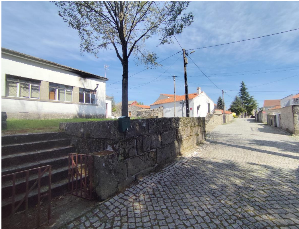
Figura 5 – perspetiva sobre Rua da Escola