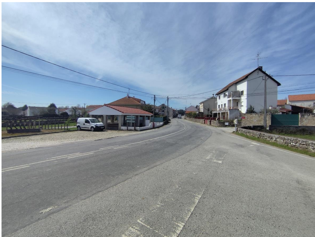
Figura 6 – perspetiva sobre Estrada Nacional EN233-3, entrada no aglomerado desde Vilar Formoso