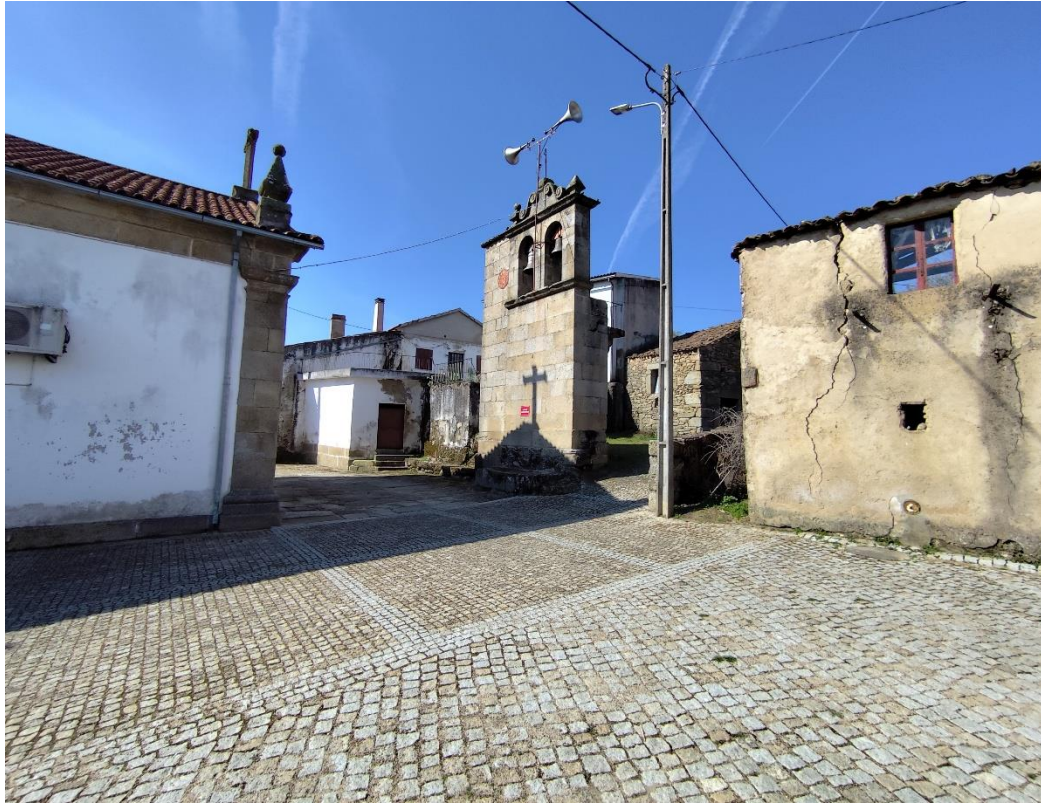
Figura 3 – perspectiva do Largo de Santo António